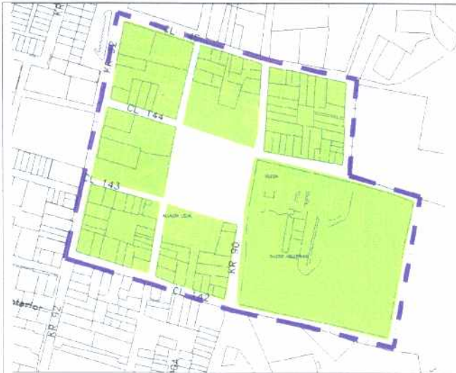
CRECIMIENTO HISTÓRICO - CRONOLOGÍA