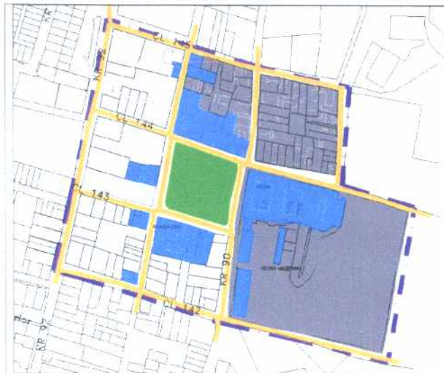
Inmuebles de Interés Cultural - MORFOLOGÍA EN PLANTA