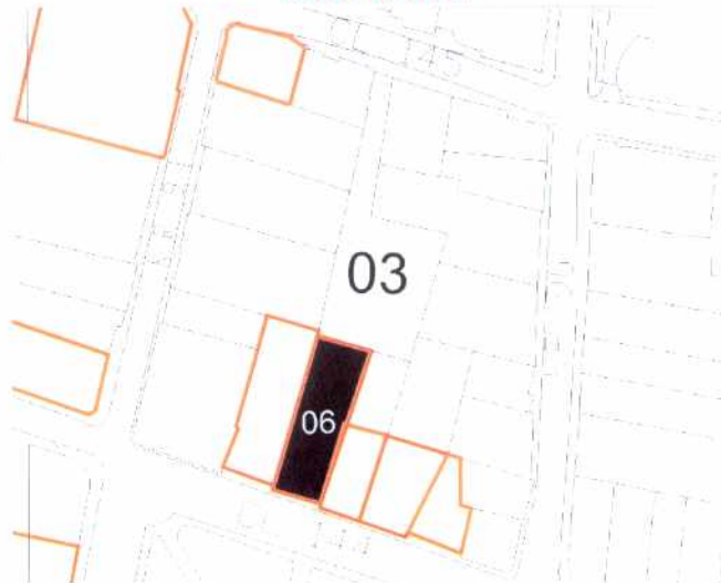
CRITERIOS DE CALIFICACION